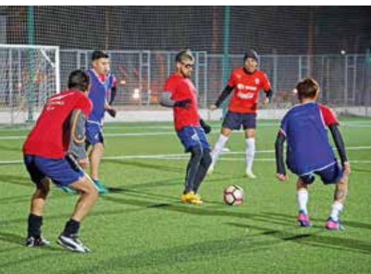
Las selecciones de Fútbol 7 y Fútbol ciego tienen canchas con medidas reglamentarias de sus deportes.